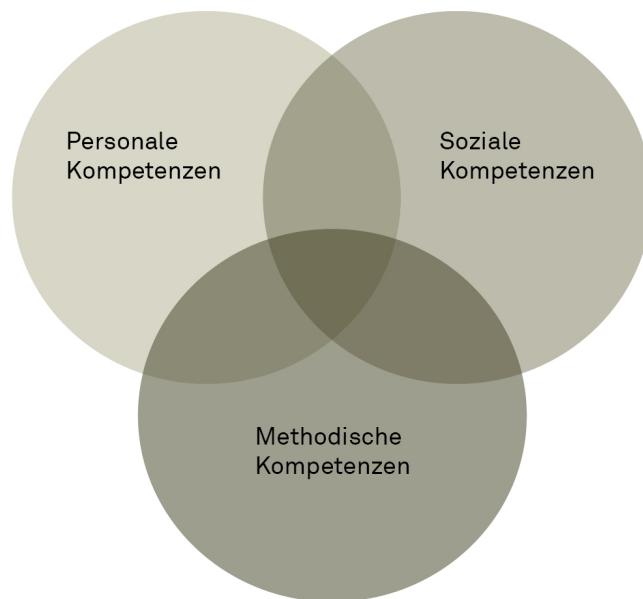
Abbildung 2: Personale, soziale und methodische Kompetenzen und ihre Überschneidungen

Überfachliche Kompetenzen sind für eine erfolgreiche Lebensbewältigung zentral. Im Lehrplan Volksschule werden personale, soziale und methodische Kompetenzen unterschieden; sie sind auf den schulischen Kontext ausgerichtet. Die einzelnen personalen, sozialen und methodischen Kompetenzen lassen sich dabei kaum trennscharf voneinander abgrenzen, sondern überschneiden sich.