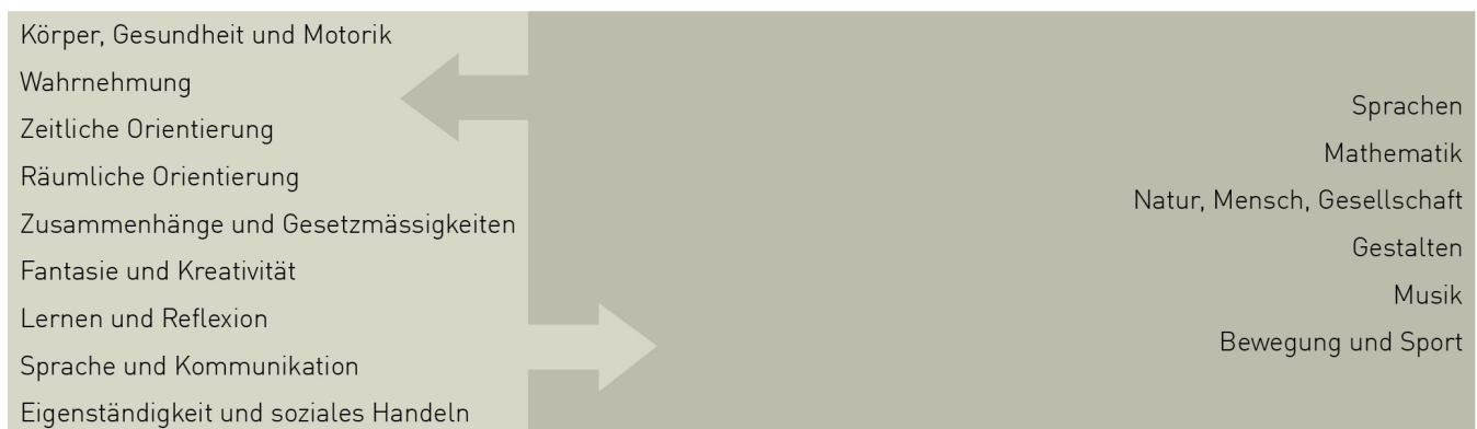
Abbildung 4: Entwicklungsorientierte Zugänge und Fachbereiche Lehrplan 21

Im Verlaufe des 1. Zyklus verschiebt sich der Schwerpunkt des Lernens von der Entwicklungsperspektive hin zum Lernen in den Fachbereichen. Die fachspezifischen Inhalte rücken zunehmend in den Vordergrund. In der Unterrichtspraxis lassen sich die entwicklungsorientierte und die fachorientierte Herangehensweise verbinden, vielfältig variieren und kombinieren. Beide Zugangsweisen bleiben miteinander verknüpft.