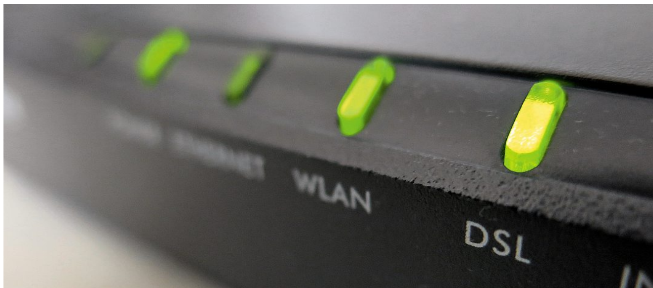
Die neue Technologie hat unser Kommunikationsverhalten und die Ansprüche an die Verbindung stark verändert.

Seit den vergangenen Herbstferien setzt auch die Schule Milchbuck in der Stadt Zürich auf WLAN in den Schulzimmern, vom Kindergarten bis zur Oberstufe. Die Stadt rüstet alle ihre Schulhäuser in den kommenden Jahren mit WLAN aus. «Als wir die Einführung thematisierten, gab es von Lehrpersonen durchaus kritische Rückfragen zur