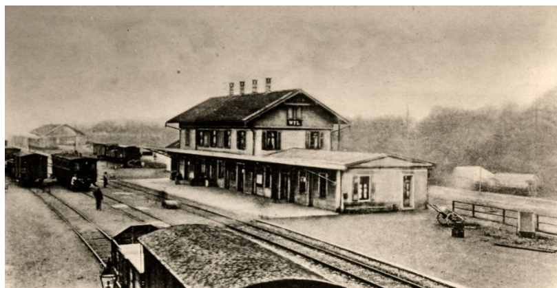
Bahnhof Wil um 1900

Wie lange dauert eine solche Fahrt heute? _____