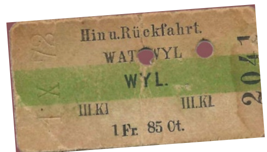
Ungefähr so gross war das Billett aus Karton in Wirklichkeit.

- Weshalb hat es wohl zwei Löcher im Billett? _____ _____ _____