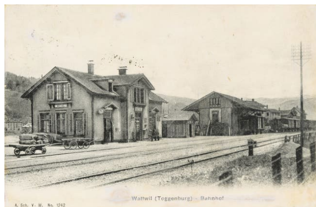
Der Bahnhof Wattwil um 1900.

Am 1. Juli 1902 wurde die Toggenburgerbahn in die Schweizerischen Bundesbahnen (SBB) eingegliedert.