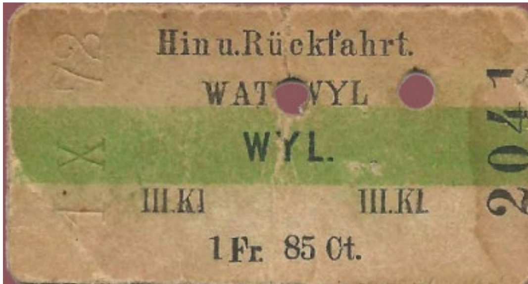
Ein Bahnbillett aus dem Jahre ...

Auftrag ▶ Schau dir das Billett ganz genau an. Notiere, was du herausfindest: